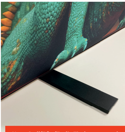
Neue Stellfüße für die Tischtrennwand – in schwarz!

Unser bewährter Aluminiumrahmen ist natürlich weiterhin in gewohnter Aluminiumoptik erhältlich.